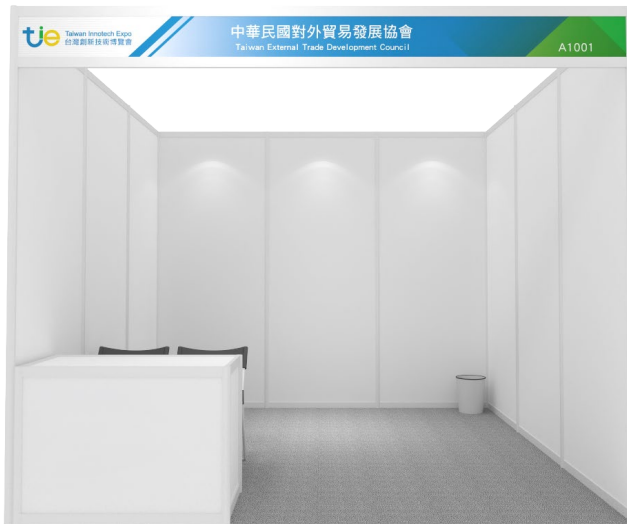
◎標攤參考示意圖，配置以實際提供為準。