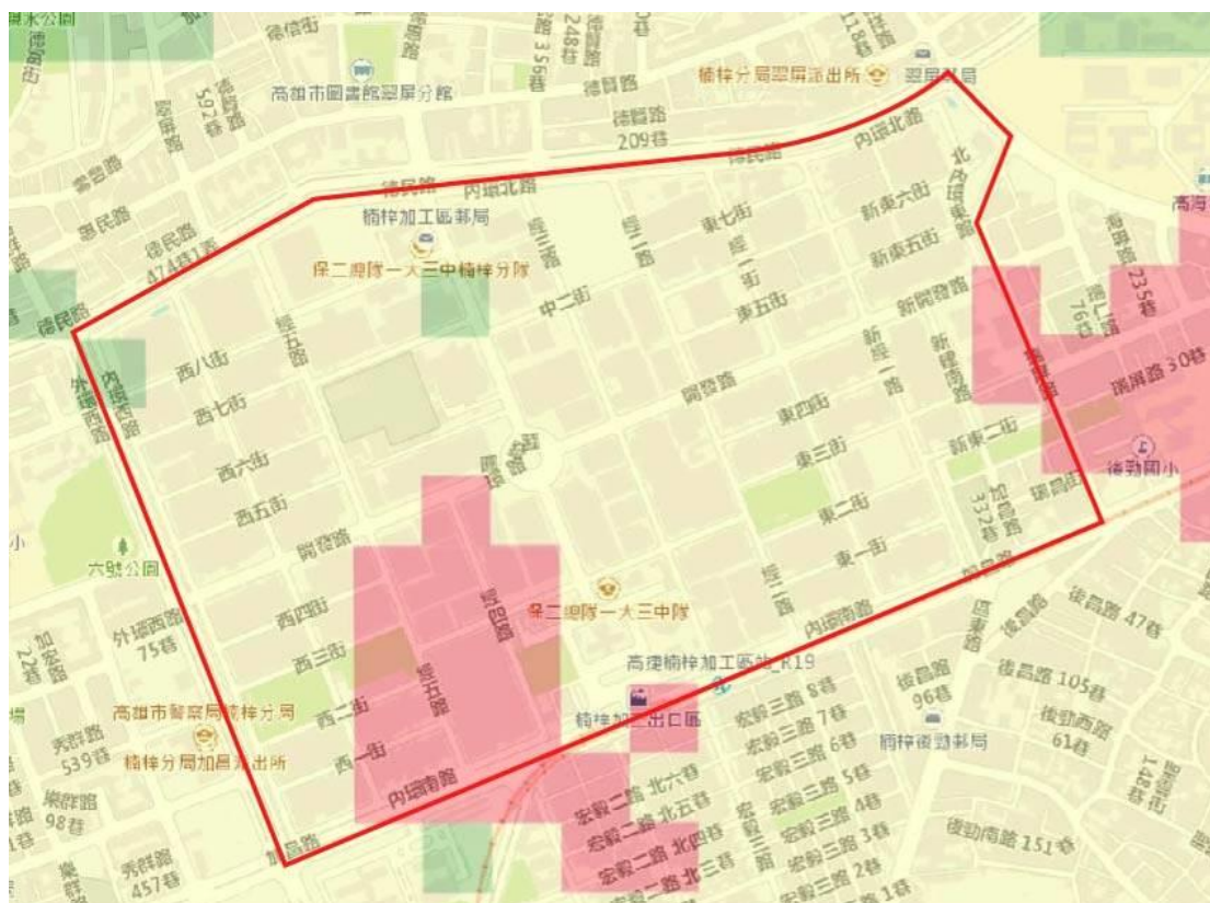
楠梓科技產業園區

於經濟部中央地質調查所「地質敏感區查詢系統」查詢彙整各園區地質敏感區域或土壤液化區域圖資，將各區域截圖已收集完成，為 10 個園區。黃色部分為低潛勢區、綠色部分為中潛勢區、紅色部分為高潛勢區域。