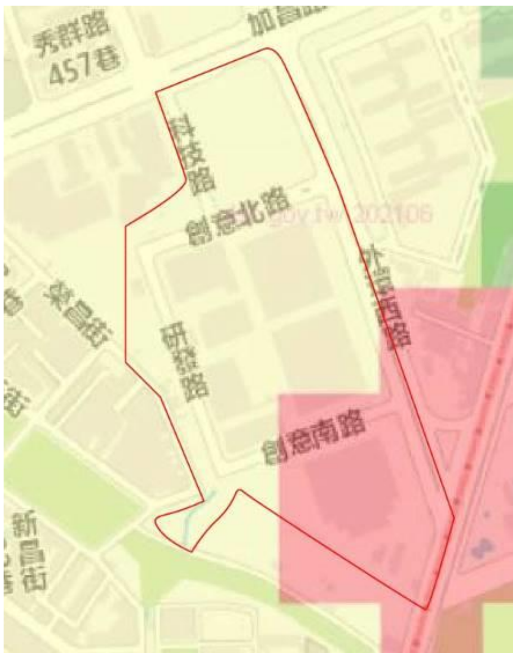
楠梓科技產業第二園區