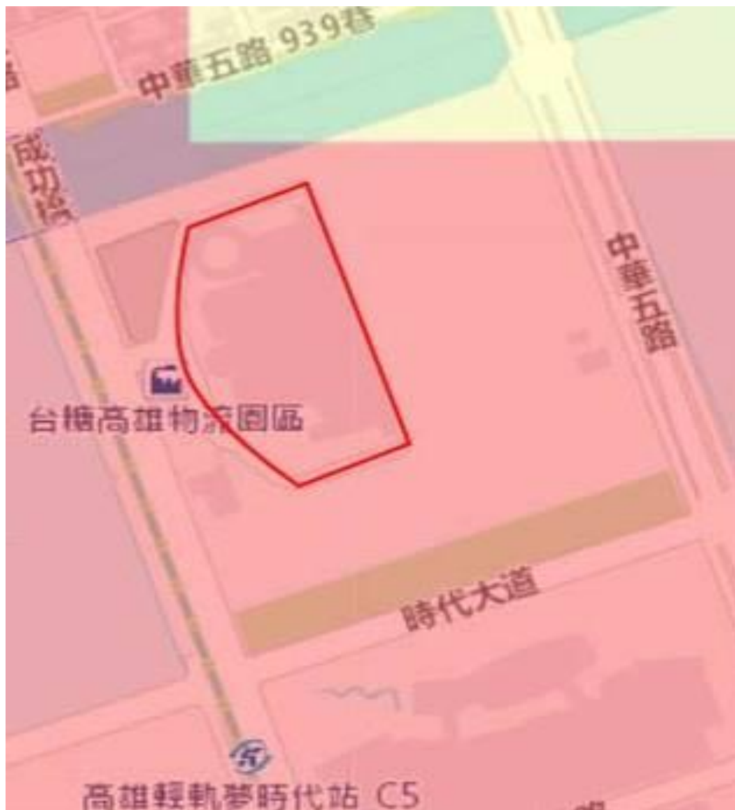
台糖高雄物流園區