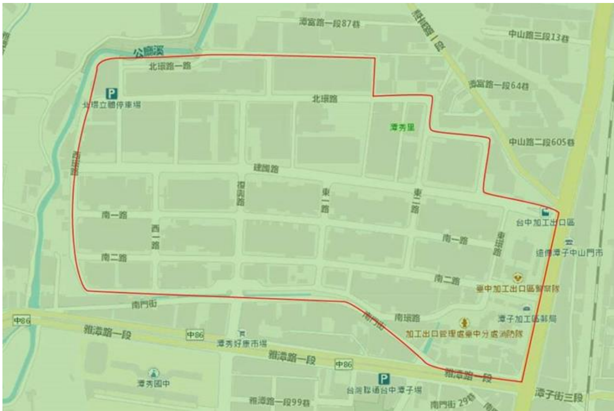
潭子科技產業園區