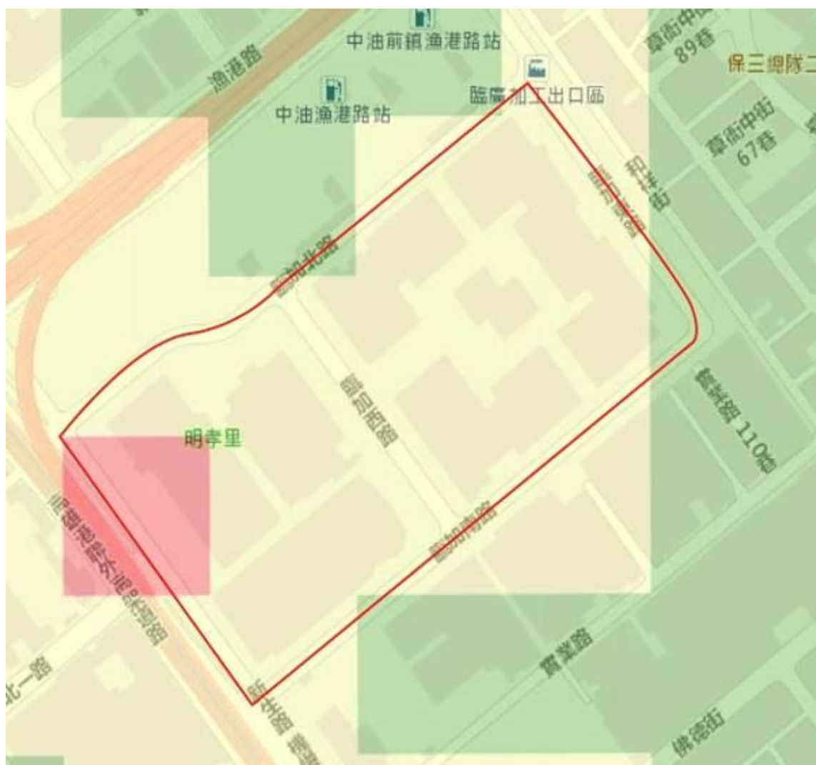
臨廣科技產業園區