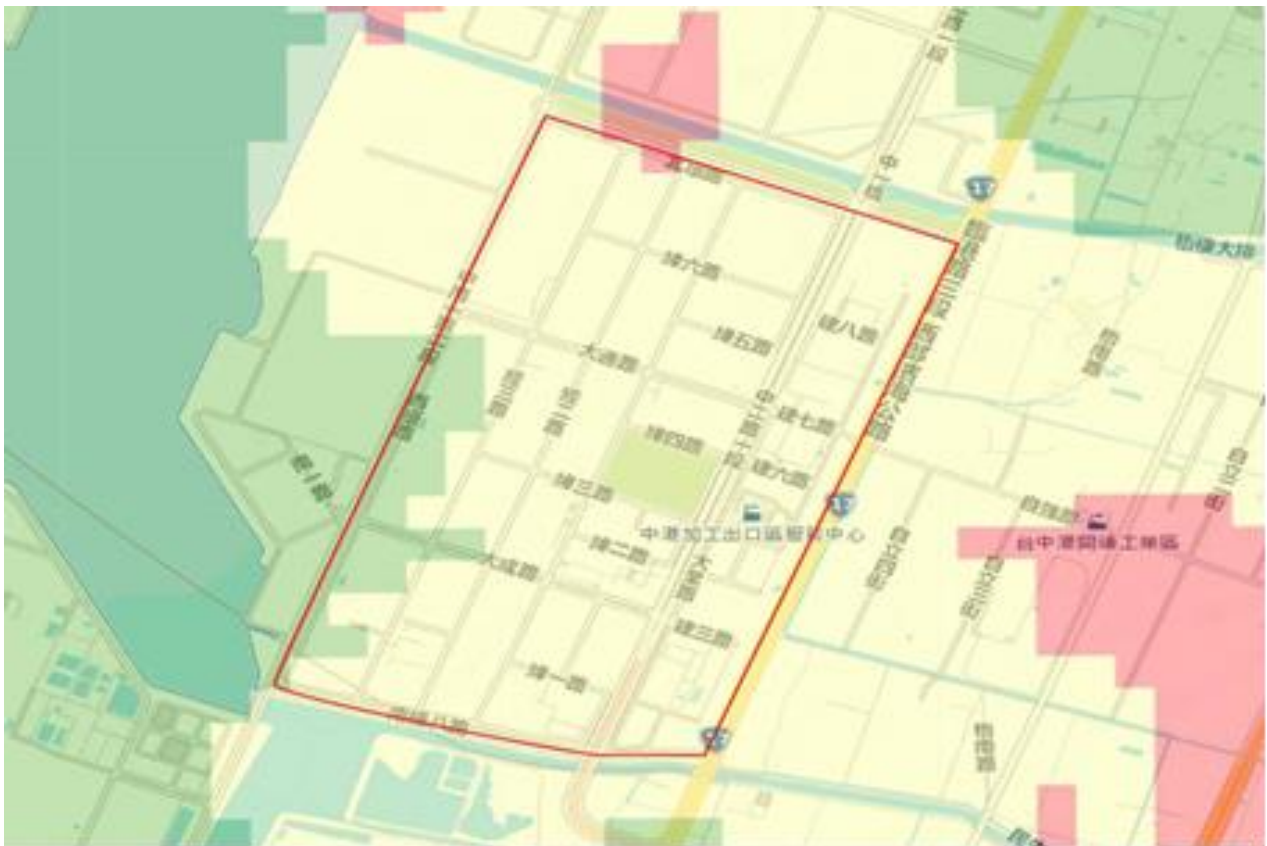
臺中港科技產業園區