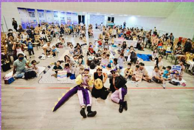
▲ 性平劇場現場大合照

「性別」可以有不同的樣子。女孩不一定要溫柔、安靜，男孩也不一定只能勇敢、強壯。每個人都可以做自己、選擇自己喜歡的樣子！未來也讓我們將「尊重多元、擁抱不同」的價值，帶到生活中的每一個角落！