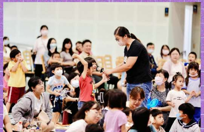
▲ 熱情滿滿的現場QA互動