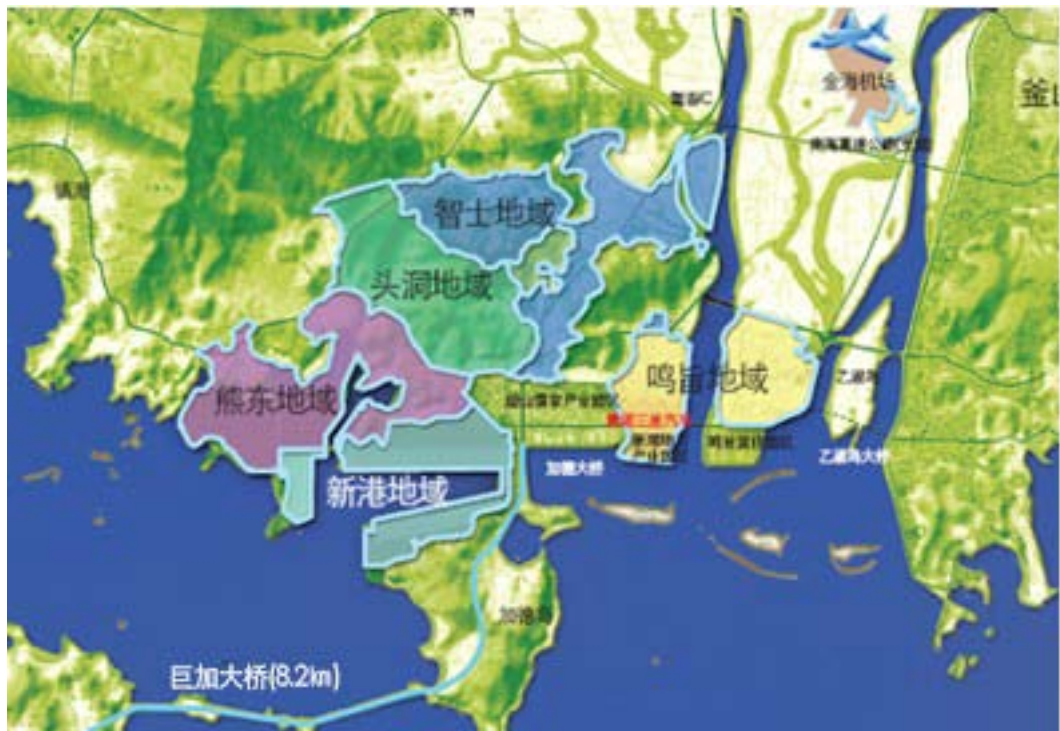
圖 2.7 釜山-鎮海經濟自由區之釜山新港