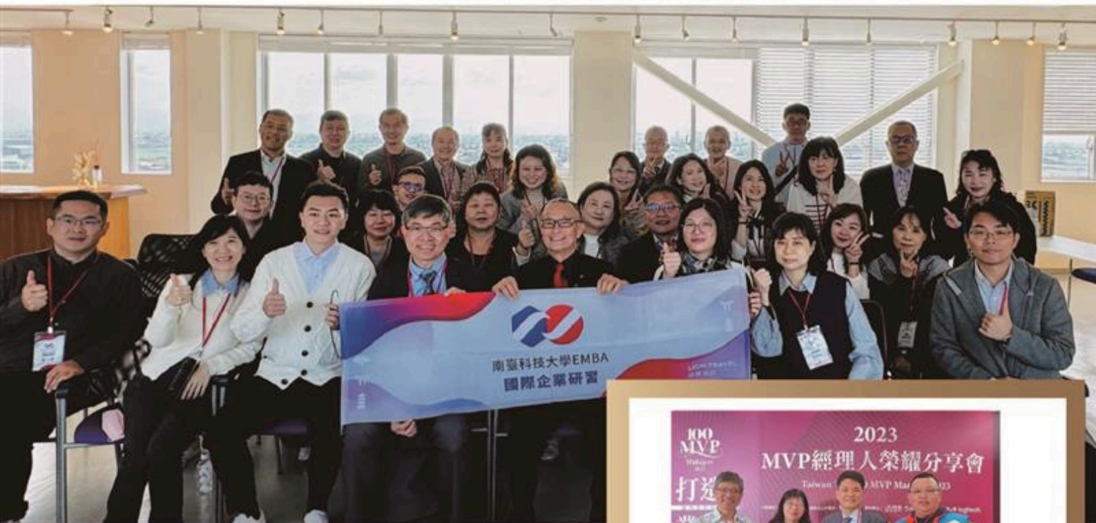
國際企業研習-赴日本九州

Executive Master of Business Administration