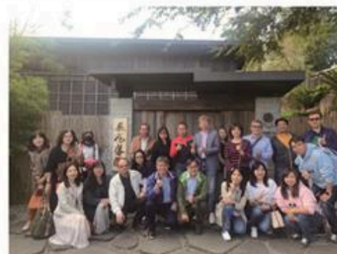
▲ EMBA企業參訪-麻葉餐飲集團-飛花落院