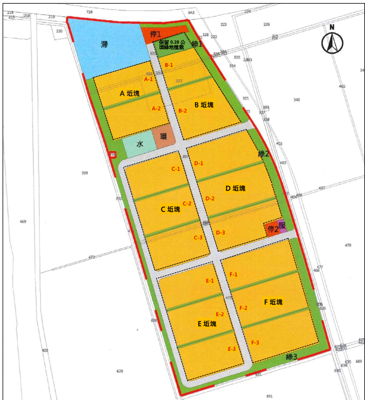
圖 2：各坵塊土地分割示意圖(相鄰坵塊自基地境界線各退縮 3 公尺建築)