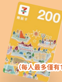
(每人最多僅有1個抽獎名額)

透過案例式問答，提升園區從業人員對於 職場公平與性平議題的認知，進一步凝聚 尊重多元、友善合作的職場共識。