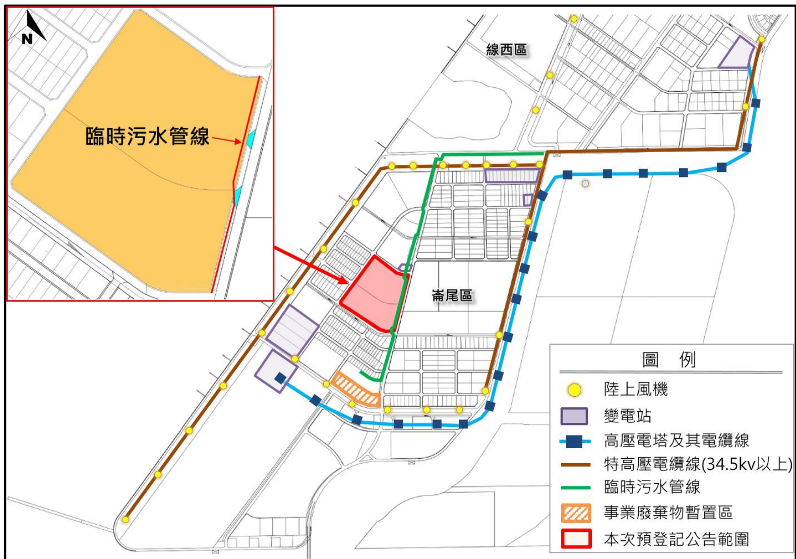
附圖3、彰濱產業園區崙尾西一區五期周遭設施示意圖