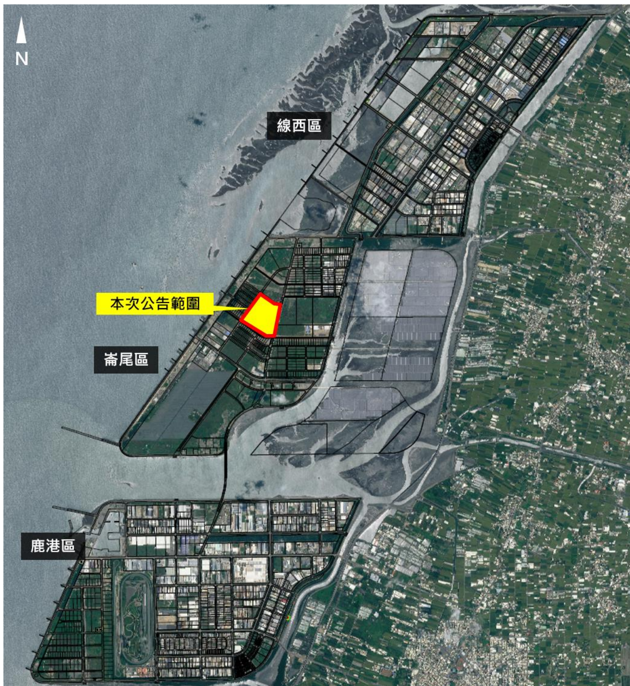
彰濱產業園區崙尾西一區五期位置及公告範圍圖