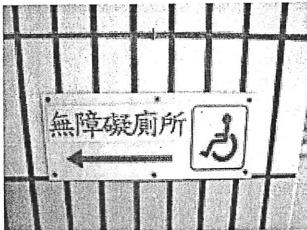
附圖 1 廁所的引導標示參考照片